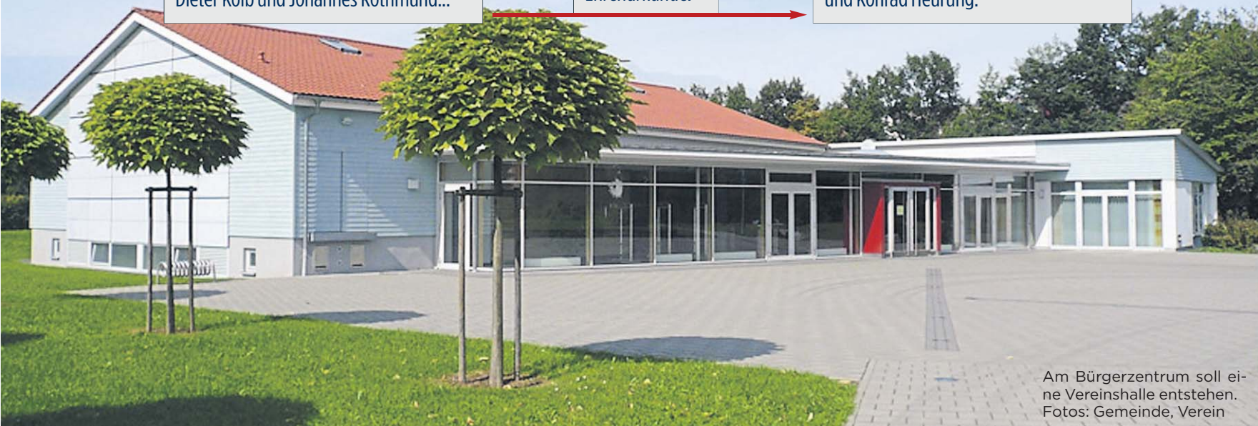
Am Bürgerzentrum soll eine Vereinshalle entstehen.